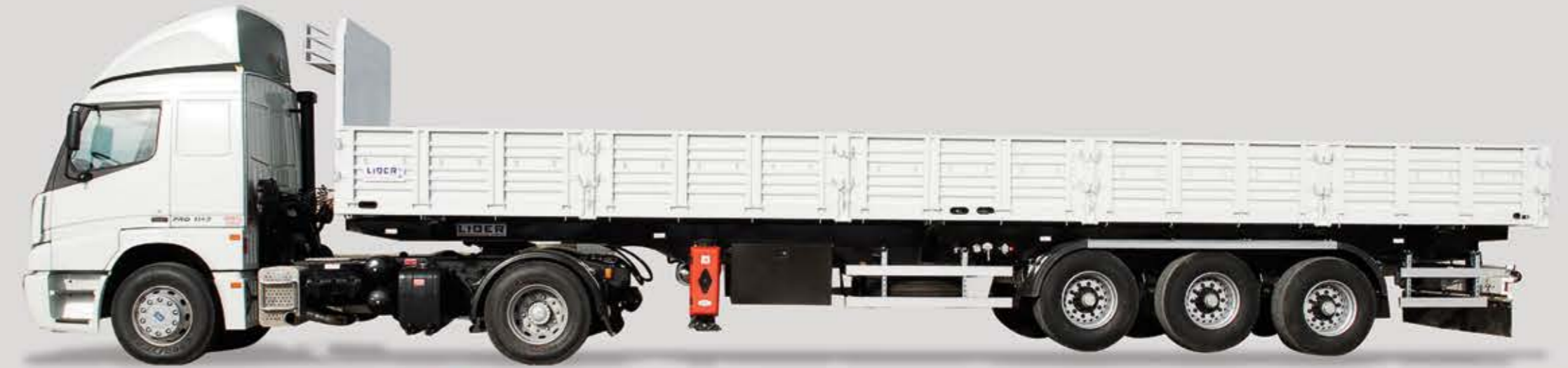
Flatbed Semi Trailer

المواصفات المذكورة اعلاه هي معايير التصنيع للشركة . هذه المواصفات يمكن ان تعدل وفقا لطلب الزبون