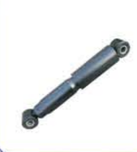
Shock Absorber ممتص الصدمات