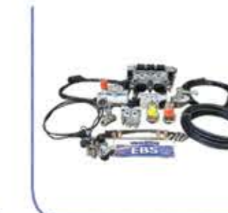
Wabco EBS Center مركز فرامل ESB ال WABCO