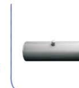
180 lt. Oil Tank خزان زيت سعة 180 لتر