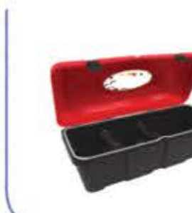
Fire Box صندوق حريق