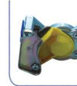
Air Coupling (Yellow) علبة وصل هوائية (صفراء)