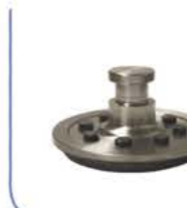
King Pin المسمار الرئيسي