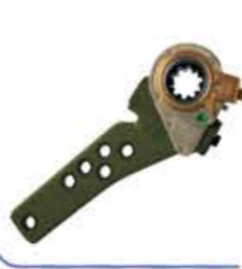
Automatic Slack Adjuster صابط ارتخاء اوتوماتيكي