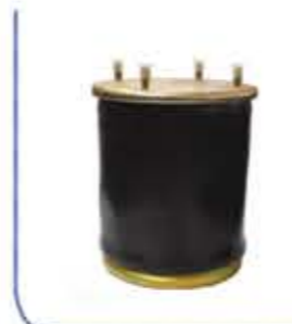
813 Bellow منفاخ 813