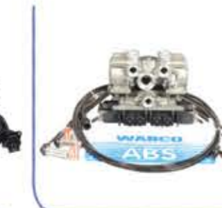
Wabco ABS Center مركز فرامل ABS ال WABCO