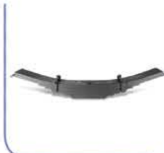
12 Layer Piled Spring النابض ذو طبقة متكدسة 12