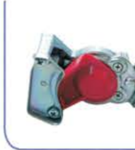
Air Coupling (Red) علبة وصل هوائية (حمر)