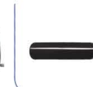
Air Tube الشريط الهوائي