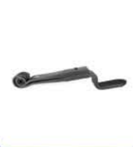
Z Spring 70 mm نابض Z 70 ملم