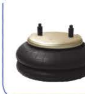
Deck Bellow منفاخ قرصي