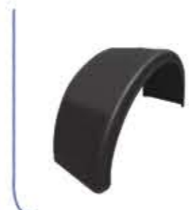
Pilot Mudguard واقى من الطين