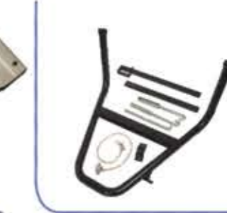
Spare Tire Carrier with Pipe حامل الاطرا مع انبوب