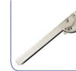
Bicycle Wheel Wedge قضيب امان للعجلات