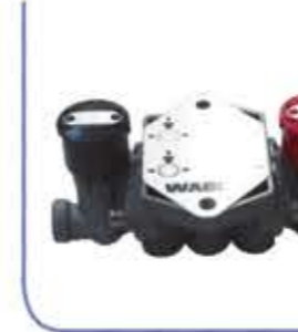
Park Button ظر التوقف