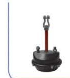
30 Ordinary Bellow منفاخ عادي 30