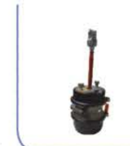
30x30 Bellow with Enmergency منفاخ مع الطوارئ 30x30