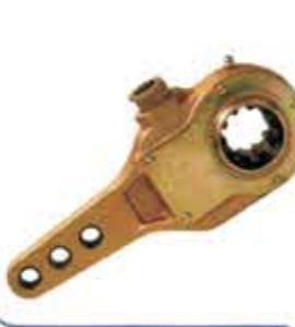
Manuel Slack Adjuster صابط ارتخاء يدوي