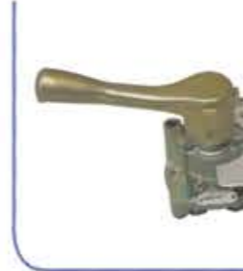
Wabco Ramp Lever ذراع ضغط WABCO