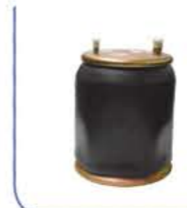
M9 Bellow منفاخ M9