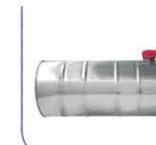
Aluminum Water Tank خزان ماء من الالمنيوم