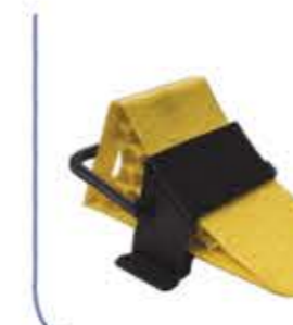
Plastic Wheel Wedge منبب عجلات منفر د بلاستيكي