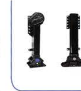
Trailer Foot اقدام المقطورة