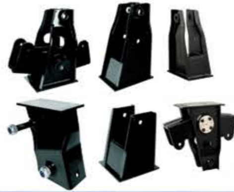
Hanger Bracket Set اداة تعليق مثبتة ماسكة